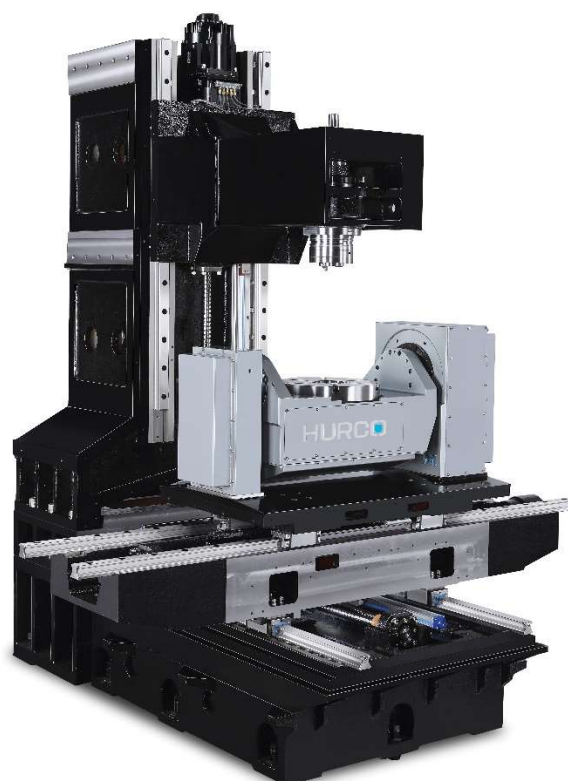
TAVOLA PORTA PEZZO

Tutti gli elementi strutturali della macchina sono ampiamente nervati e realizzati in fusione di ghisa di alta qualità. Vengono progettati con l'ausilio del calcolo strutturale (FEA) per valutare la rigidità e la torsione strutturale, le caratteristiche termiche e le naturali frequenze, al fine di ottenere la massima rigidità e stabilità geometrica e termica, anche in presenza di carichi e sollecitazioni elevati.