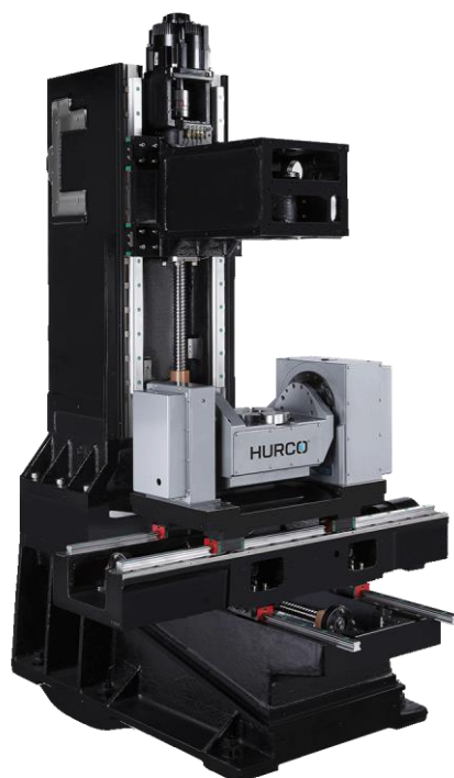
TAVOLA PORTA PEZZO

Tutti gli elementi strutturali della macchina sono ampiamente nervati e realizzati in fusione di ghisa di alta qualità. Vengono progettati con l'ausilio del calcolo strutturale (FEA) per valutare la rigidità e la torsione strutturale, le caratteristiche termiche e le naturali frequenze, al fine di ottenere la massima rigidità e stabilità geometrica e termica, anche in presenza di carichi e sollecitazioni elevati.